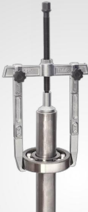
TMMR.. XL 附 2 個選配的延長段